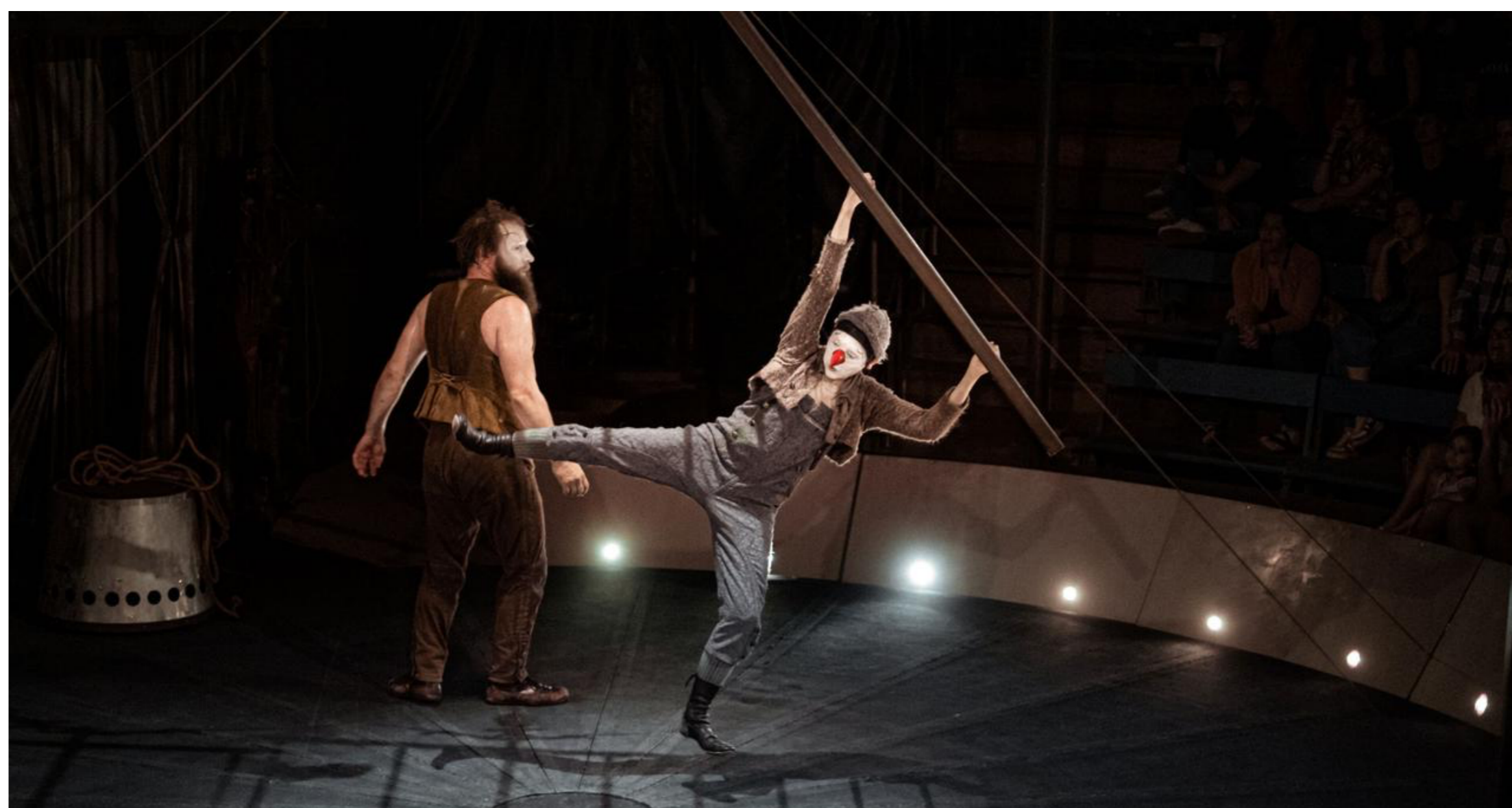
Le duo Titoune-Bonaventure dans son spectacle "Strano".

>> A lire également : Extraordinaire "Strano", dernier bijou du Cirque Trottola installé à Vidy-Lausanne